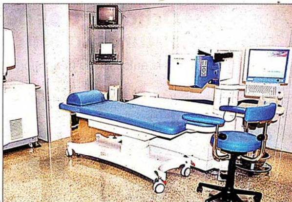
El Institut Oftàlmic de Mallorca dispone del làser Amaris de sexta generació per a realitzar les intervencions.